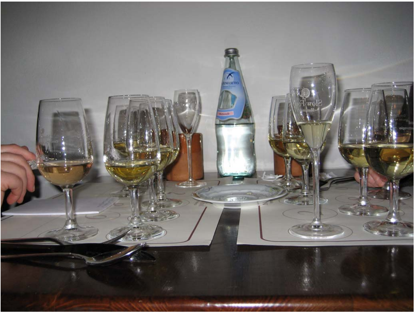
protagonisti i vini bianchi dai vari colori profumi e sapori