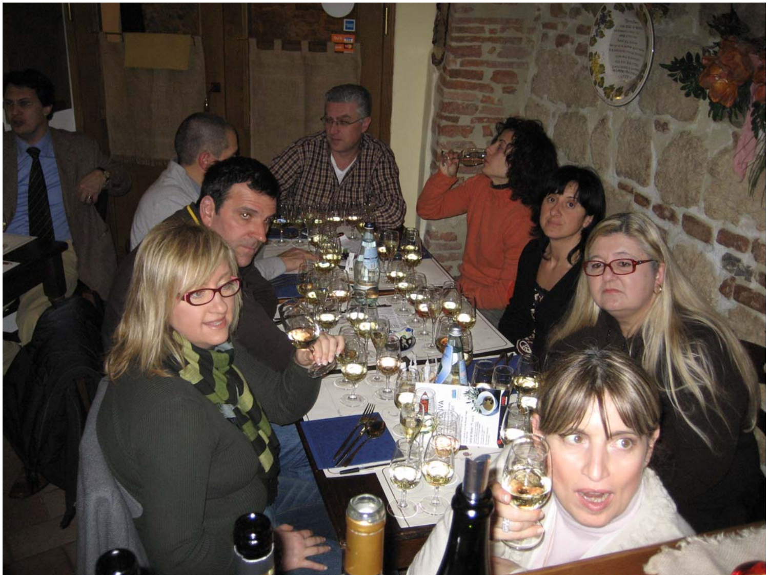
Momenti della serata