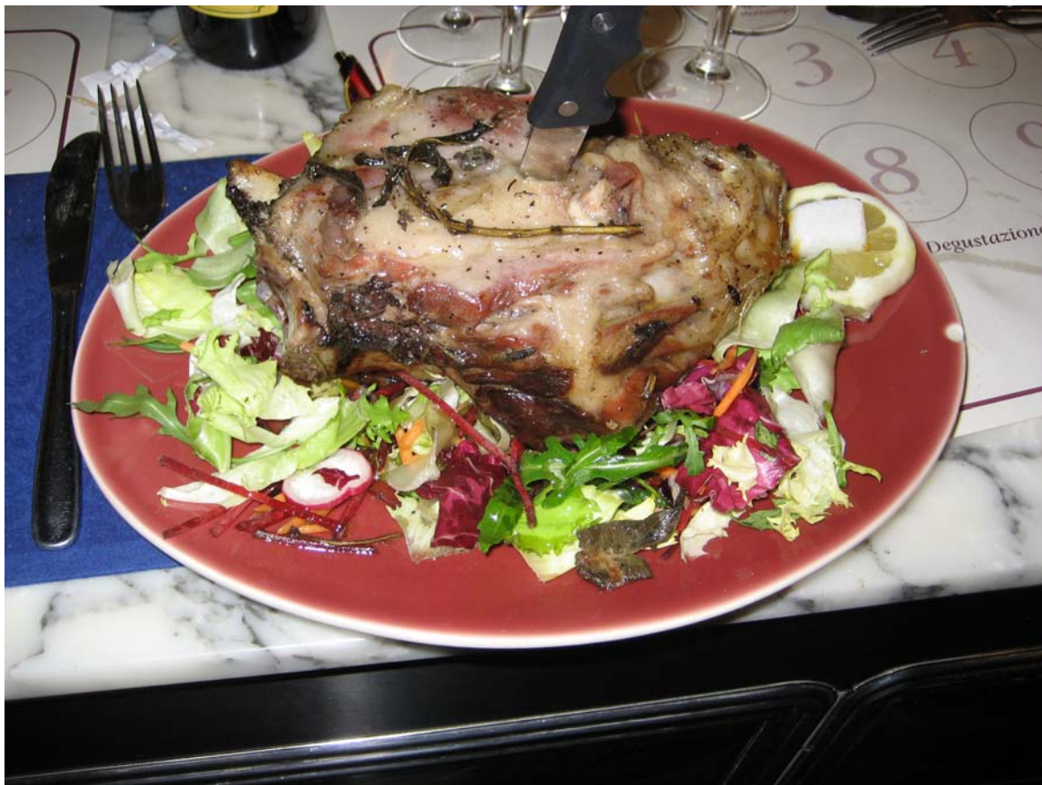
lo stinco di maiale al vin bianco