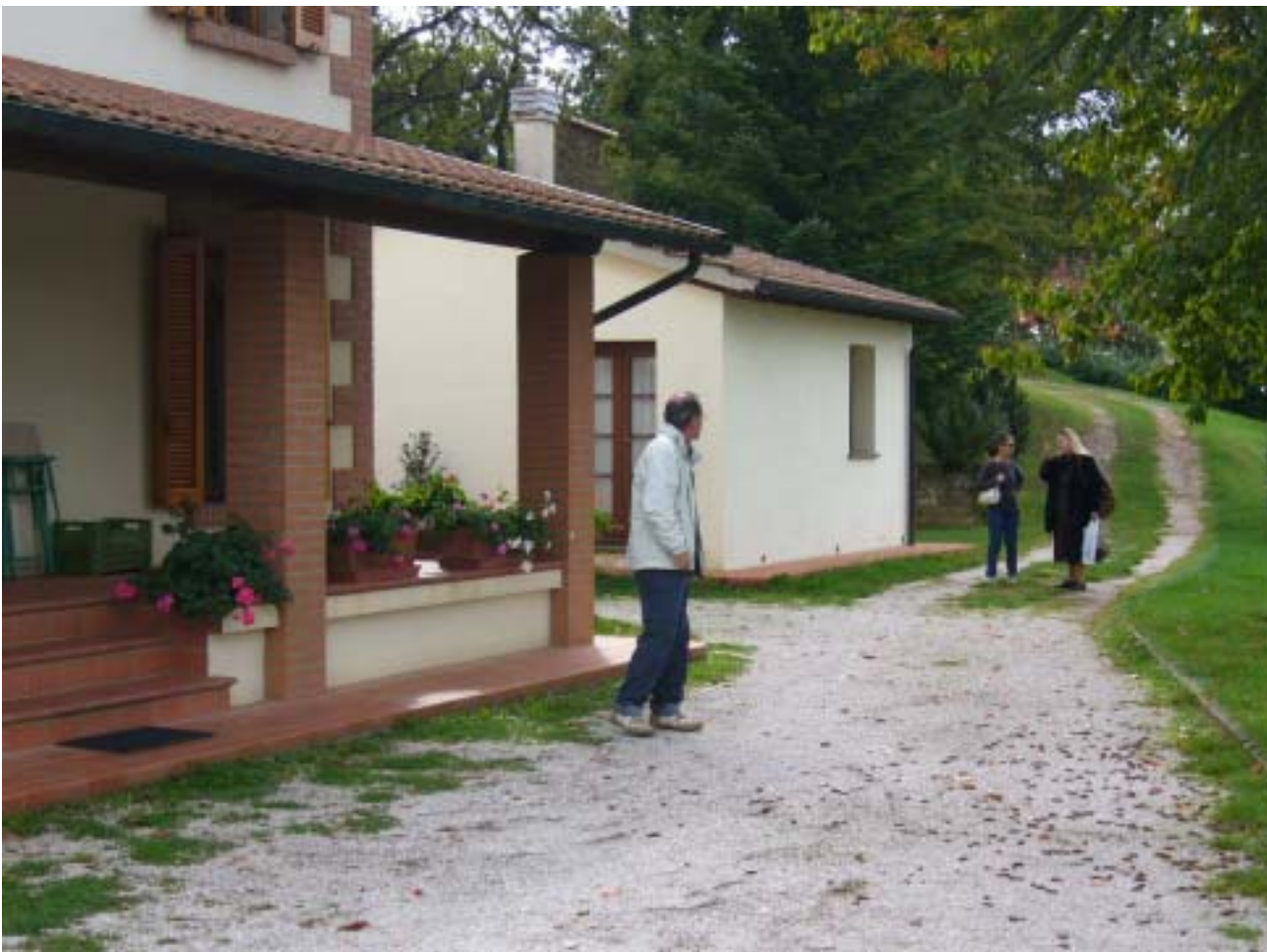
Vari scorci dell'ambiente che ha ospitato l'iniziativa