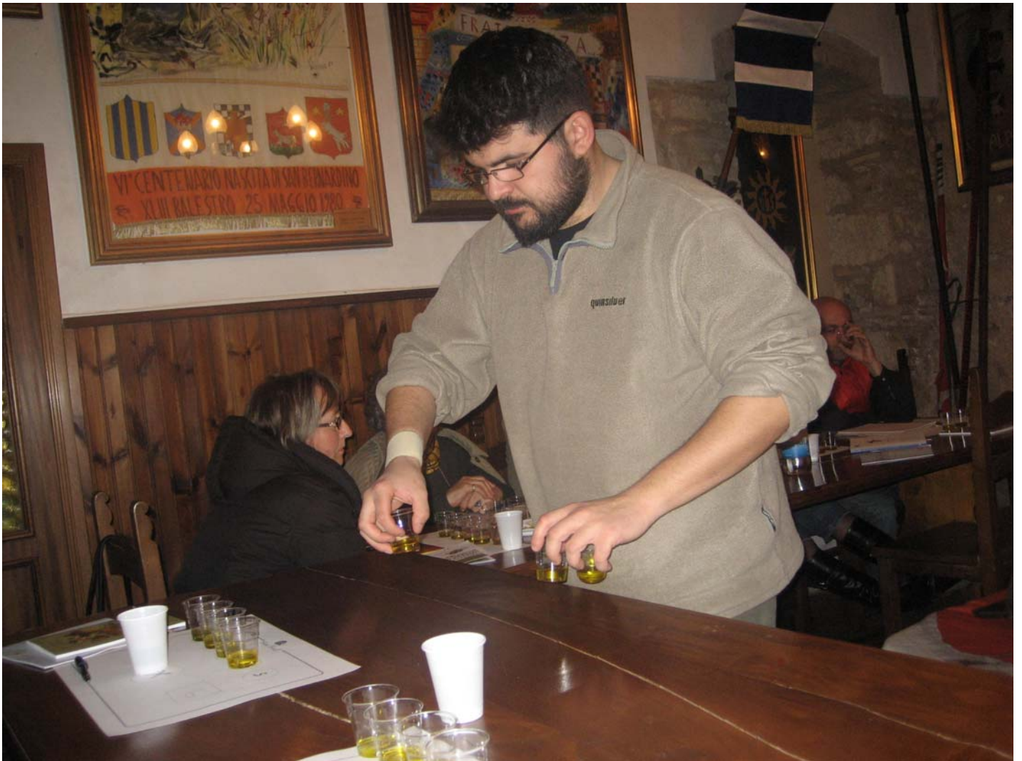
Questa volta anche il Fiduciario era tra i partecipanti ▼