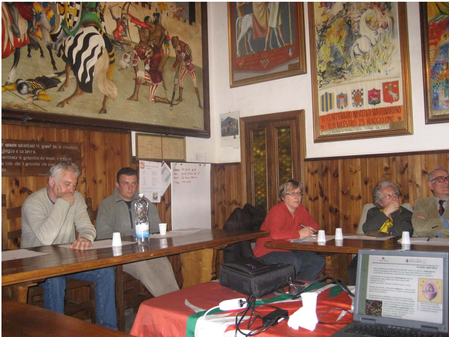
▲ La splendida "location" e l'attenzione dei partecipanti ▼